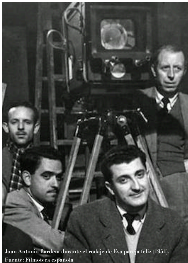
Juan Antonio Bardem durante el rodaje de Esa pareja feliz (1951).

Este encuentro pretende que profesores y estudiantes reflexionen sobre el poder del humor como herramienta de inmersión cultural y lingüística, con el fin de disfrutar de la dimensión más festiva, lúdica y crítica del hispanismo.